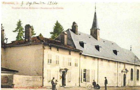
L'établissement avant la Grande Guerre

Avant d'être administré par les sœurs de Saint-Charles, aujourd'hui devenu EHPAD (Etablissement d'Hébergement pour Personnes Agées Dépendantes), l'Hôpital, ou Maison-Dieu , fut confié aux religieux Antonistes de Bar-le-Duc de 1374 à 1763, soit pendant près de 400 ans.